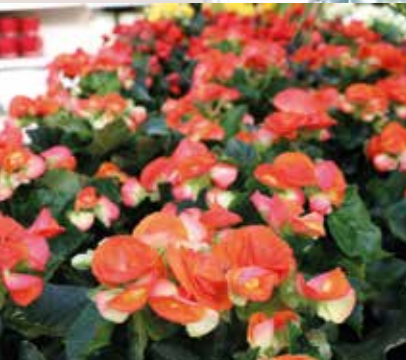
Zimmerpflanzen richtig pflegen